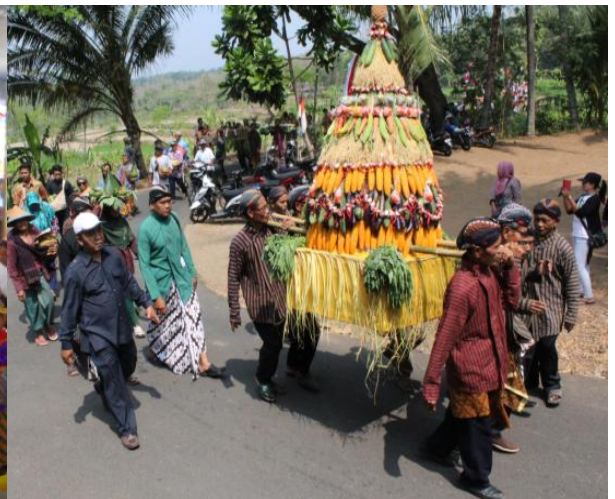
Foto 13. Upacara Adat