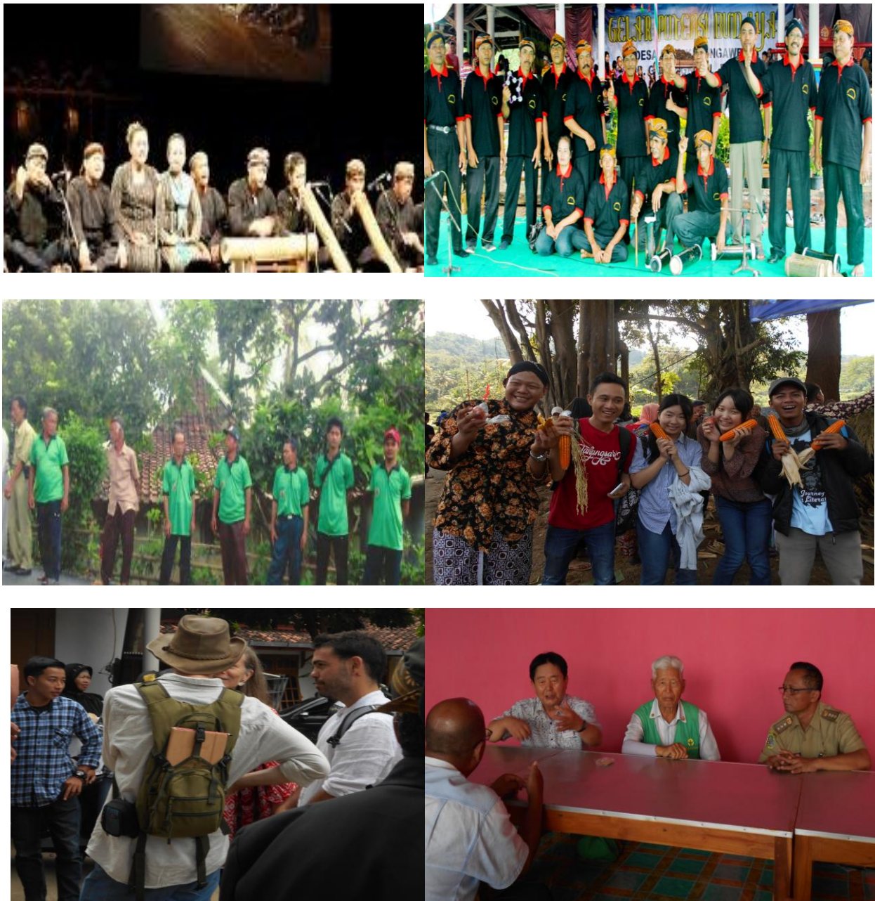
Foto 6. Berbagai cara Penyambutan wisata

Menampung pendapat wisatawan serta menindaklanjutinya secara periodik