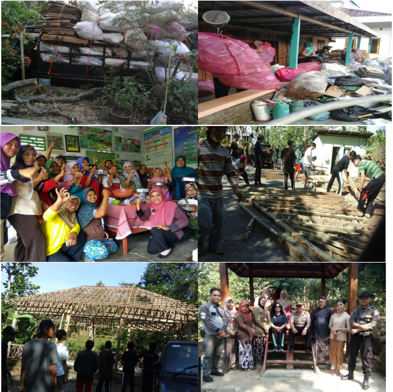
Foto 9. Pengelolaan Sampah