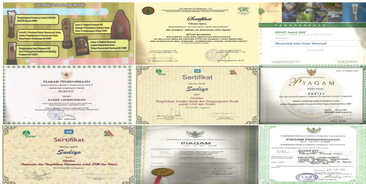
Foto 8. Penghargaan