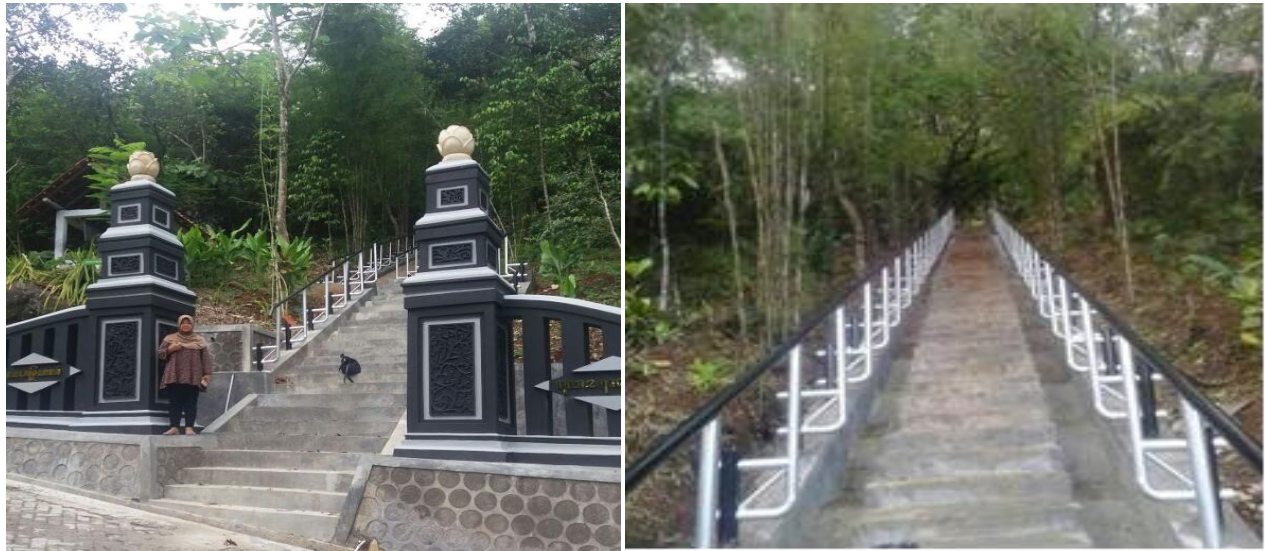
Foto 4. Pintu Masuk melalui Tangga Seribu obyek wisata Wonosadi

Kegiatan yang telah dilakukan dalam rangka menciptakan Lingkungan yang Sejuk dan Indah adalah :