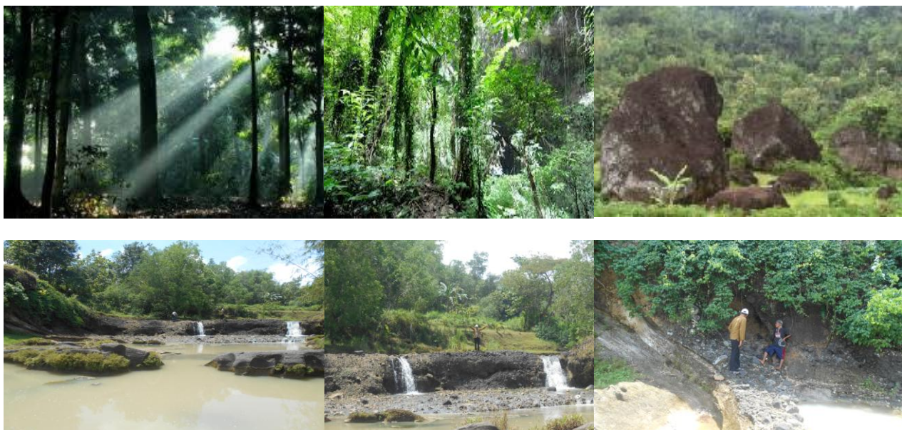
Foto 5. Panorama Penyangga kawasan wisata Beji

Wonosadi merupakan hutan yang dapat melindungi dan menyediakan ekosistem alam agar semua bisa hidup nyaman dalam rimbunan hutan.