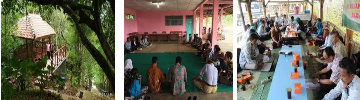
Foto 3. Sosialisasi dalam Pertemuan Anggota

Partisipasi aktif dalam berbagai kegiatan untuk mendorong kemajuan organisasi Desa Wisata.