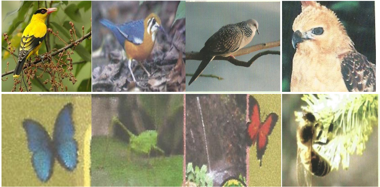
foto 11. Flora dan Fauna