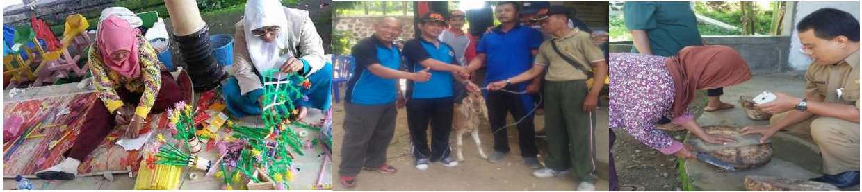
Foto 10. Pemberdayaan masyarakat