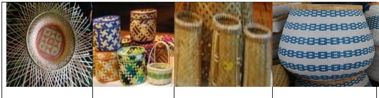
Foto 7. Kerajinan dan industry Rumah Tangga

UPAYA DALAM RANGKA MENINGKATKAN WAWASAN MASYARAKAT MENGENAI PENTINGNYA SAPTA PESONA DI LINGKUNGAN MASING-MASING